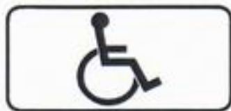
Знак 8.17 «Инвалиды»

Парковка для инвалидов бесплатна круглосуточно на местах, отмеченных знаком 8.17 «Инвалиды», а также разметкой 1.24.3 «Инвалиды». Распознавание автомобиля инвалида автоматическими средствами контроля возможна после оформления парковочного разрешения инвалида.