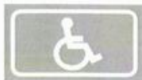
Разметка 1.24.3 «Инвалиды»